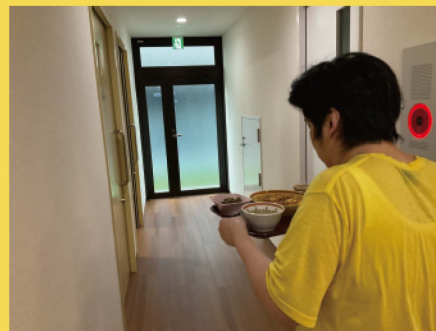
部屋まで運びます