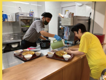
食事を取りに行きます