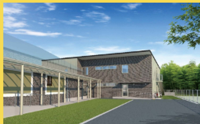
本部事務所/コヘレト事業所に隣接しています

2021年6月、DOHOグループの新しい施設「グループホームおりぶ」がOPENしました。入居者の方もすべて入られて、それぞれ新しい暮らしをスタートされています。